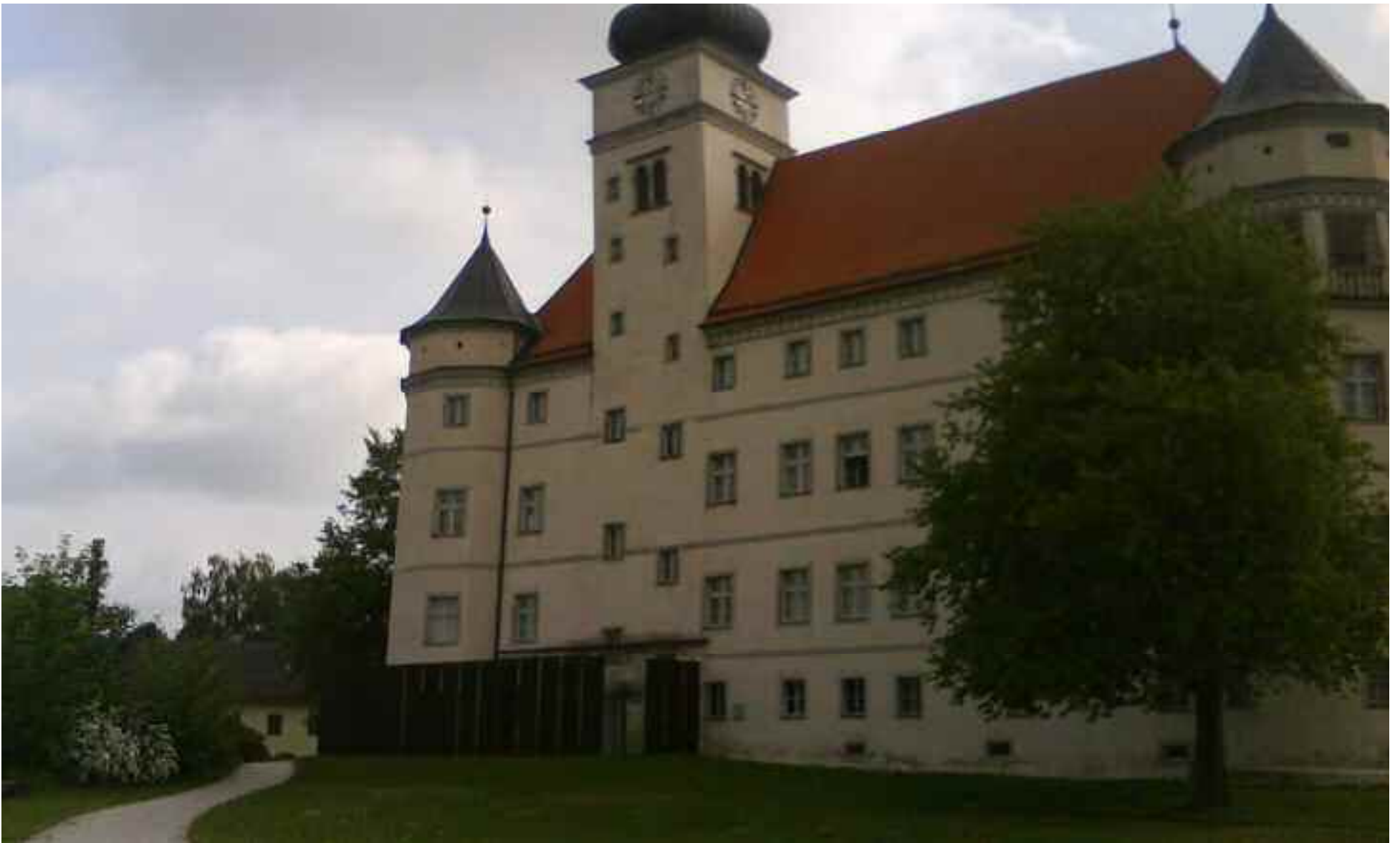
Castillo de Hartheim, ligado a la siniestra represión y exterminio que llevaron a cabo los nazis