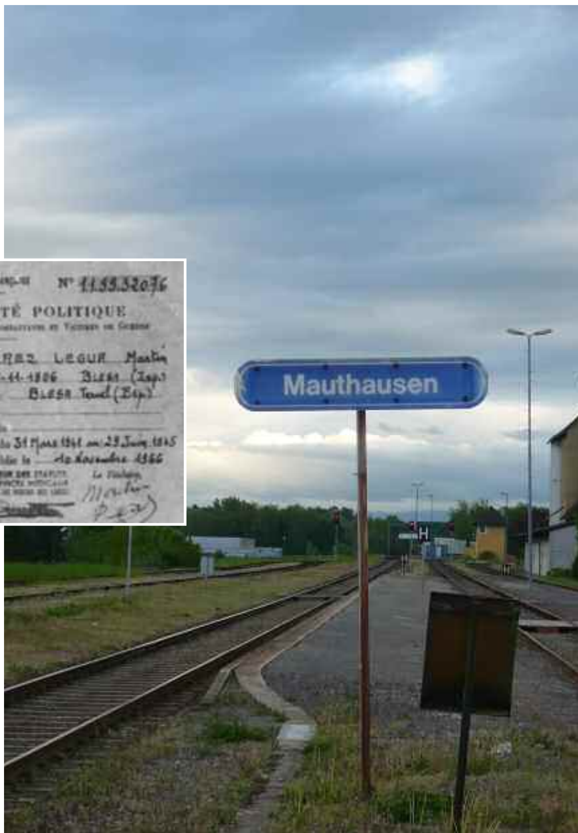
Estación de tren de Mauthausen, a la que llegaban los republicanos deportados al campo de concentración

Hubo republicanos deportados a otros campos tras su detención por haber participado en la Resistencia clandestina contra la ocupación alemana. A partir de 1943, los alemanes decretaron vaciar las cárceles y organizar su deportación a Alemania para utilizarlos como mano de obra esclava en la industria de guerra: Dachau, Buchenwald, Neuengamme, Mauthausen, Ravensbruck, ... fueron los destinos hacia donde partieron cientos de convoyes desde el territorio francés, la mayor parte de ellos del campo de Compiègne, ubicado en las cercanías de París. Pedro