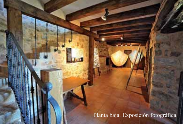
Planta baja. Exposición fotográfica