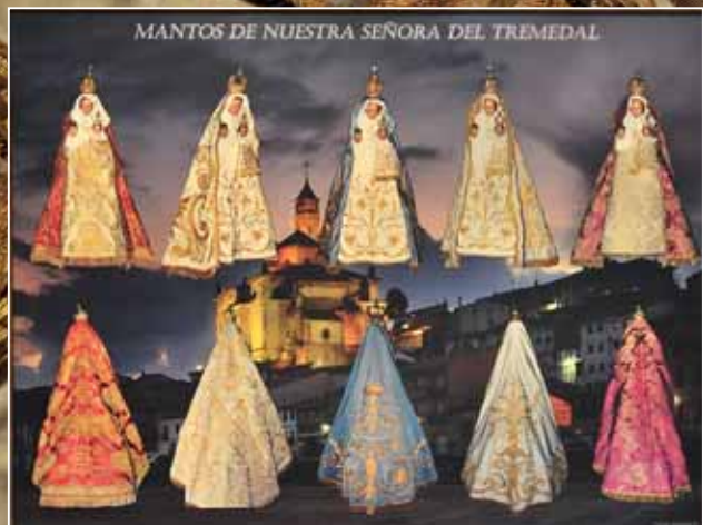
Mantos de la virgen. Un rico patrimonio