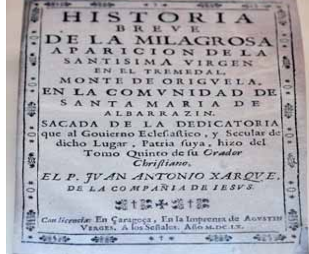
La historia más antigua sobre la virgen del Tremedal, 1660.

vitrina aquellos documentos históricos que han destacado en determinados períodos de la historia del culto a la virgen del Tremedal.