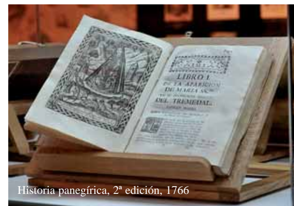
Historia panegírica, 2ª edición, 1766

La exposición finaliza con el panel conmemorativo del III Encuentro de la virgen del Tremedal celebrado el histórico día del 14 de junio de 2008. Está situado en la pared a espaldas de la sala.