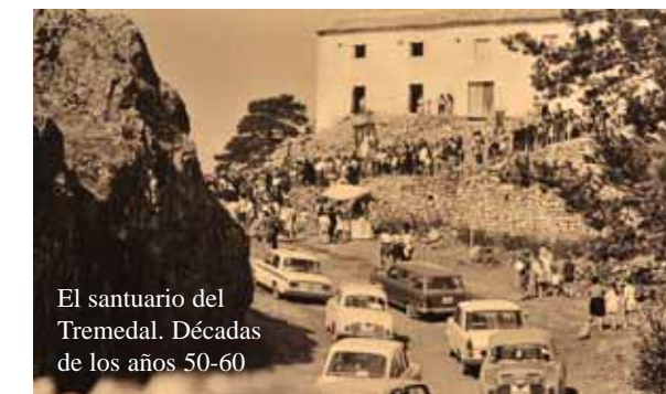
El santuario del Tremedal. Décadas de los años 50-60

El panel central ofrece información sobre el patrimonio arquitectónico y paisajístico de los pueblos que todavía veneran a la virgen del Tremedal. Además se explican las causas por las cuales llegó hasta