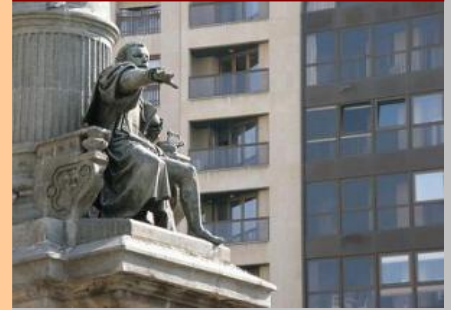
Monumento al Justicia