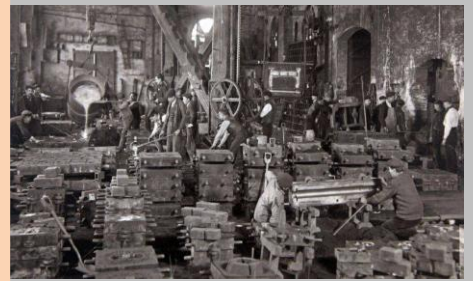
Muchos colectivos, intelectuales, más de 200 doctores y profesores universitarios, APUDEA, Salvemos Averly se han sumado a la petición de BIC

Según denuncia APUDEPA se están trasladando miles de piezas, en torno a 20.000, a una de las naves ante la presión de la promotora de las viviendas, Neurbe, incluso ha habido piezas que han ido a la chatarrería sin que la DGA haya dicho nada. "Desde el 11 de Enero de 2014, Neurbe se ha dedicado a dismantelar el mobiliario de ciertas naves de la fábrica a pesar de que ello contraviene el espíritu y la letra de la Licencia Urbanística de Aragón...". Parece ser que la promotora tiene la obligación de no demoler nada, además de reparar y apuntalar las cubiertas de las naves y edificios de la factoría que no entran en lo reconocido como Bien Catalogado, según consta en la Resolución de 21 de Enero de 2014, emitida por la Inspección Urbanística del Ayuntamiento. La DGA está avisada del conflicto generado.