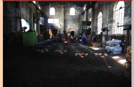
Vista de una de las naves, llama la atención el diseño arquitectónico de la nave que permite la entrada de luz exterior natural. Abajo una bancada de hierro fundido, pieza de grandes dimensiones...