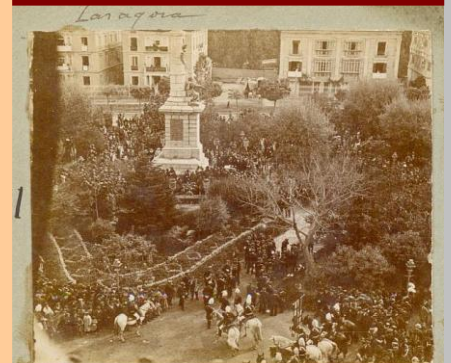
Inauguración del monumento el 22 de Octubre de 1904