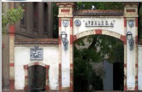
Puerta de entrada de la fundición.