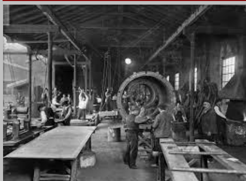
En Averly se hacía de todo en hierro fundido y en bronce. Máquinas, esculturas, farolas, etc., etc.