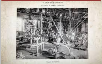
Postal antigua del taller de tornos

Como no podía ser de otra manera, también interviene el Justicia de Aragón, normalmente requerido por la parte más débil... Pues bien, el Justicia da por buena la catalogación dada por la DGA a la factoría Averly, aunque pide cautela a las partes por el tema demoliciones, al menos hasta que ese acuerdo de la DGA sea definitivo, o sea, sin posibilidad de impugnación (como así ocurrió al llevarlo al TSJA por APUDEPA).