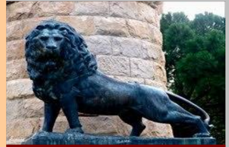
El león del Batallador