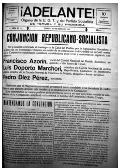
Candidato en las elecciones Constituyentes de 1931 por Teruel.