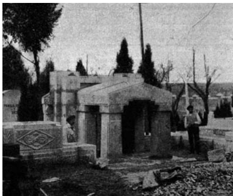
Proyecto de mausoleo para Pablo Iglesias en el cementerio civil de Madrid obra de Azorín

Cooperativa que a la altura de agosto de 1934 contaba ya con 60 socios, siendo su secretario Manuel Ferrer. En este caso creemos que a pesar de constituirse la sociedad promotora de las viviendas y la realización de varias asambleas de socios, no se inició la construcción de ninguna edificación. No sabemos las razones de este “fracaso” pues la necesidad de una vivienda digna y económica era una de las demandas de las organizaciones obreras que más se repetía en todas las celebraciones del 1º de mayo.