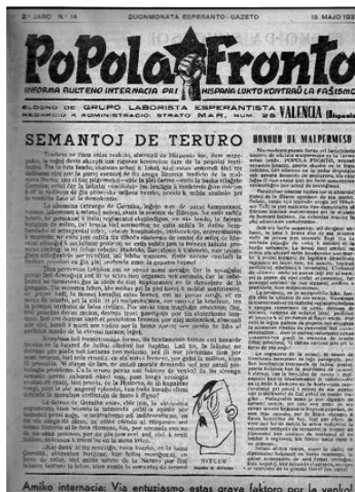
Periódico del Frente Popular escrito en esperanto.