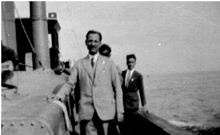
¿Azorín en el Ipanema rumbo al exilio a México?

En la actualidad una calle de Córdoba lleva su nombre y junto a otros arquitectos fue homenajeado en 2007 en una exposición en Madrid bajo el título “Arquitectos desplazados, arquitectos del exilio español” en recuerdo de las docenas de arquitectos represaliados por el Franquismo.