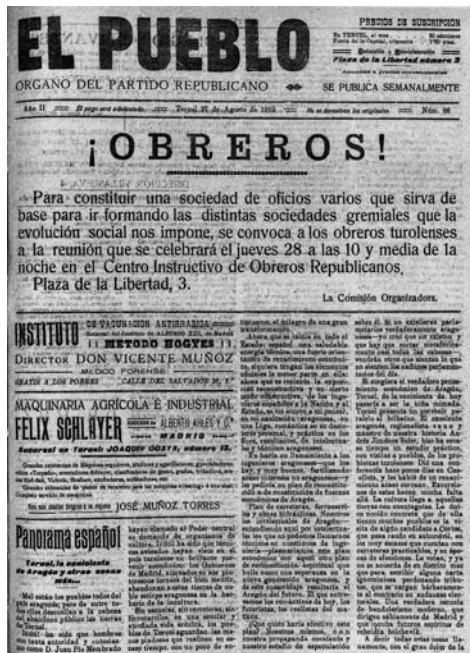
Convocatoria para formar una sociedad obrera que promovió Azorín en Teruel.

Durante dicho mes, dentro del proceso de formación de candidaturas, se iban a celebrar las asambleas de las agrupaciones socialistas de la provincia de Teruel 17 que eligieron por unanimidad al que iba a ocupar el puesto reservado en la Candidatura Republicano Popular y que recayó en el catedrático de la Escuela Normal de Magisterio Pedro Díez Pérez que en esos momentos era el dirigente socialista de la provincia con mayor prestigio. Éste debía incorporarse en representación del PSOE a dicha lista que se había pactado en el mes de mayo dentro de la Conjunción Republicano-Socialista (CRS) de la provincia de Teruel junto a otros cuatro republicanos de centro izquierda: Vicente Iranzo (Agrupación Al Servicio de la República), Ramón Feced y Gregorio Vilatela (ambos del Partido Radical Socialista) y José Borrajo (Partido Republicano Radical). Sin embargo la ruptura de la CRS con la salida del Partido Radical de Borrajo, que obedecía así las indicaciones del líder carismático Lerroxx, hizo que los otros candidatos buscaron un sustituto de Díez Pérez en la Tierra Baja y lo encontraron en la figura de Martín Sauras que se integró en la candidatura.