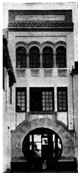
Otras de sus obras: la Casa del Pueblo de Córdoba.

Esta sociedad obrera, que es la primera de la tenemos constancia y cierta información, se constituyó en el mes septiembre de 1919 al abrigo y con el aliento del Centro Instructivo de Obreros Republicanos (CIOR) que tenía su local en la calle de Muñoz Degraín y anteriormente en la Plaza de la Lombardera, donde se ubicaba también la sede del Partido Republicano de Teruel (PRT).