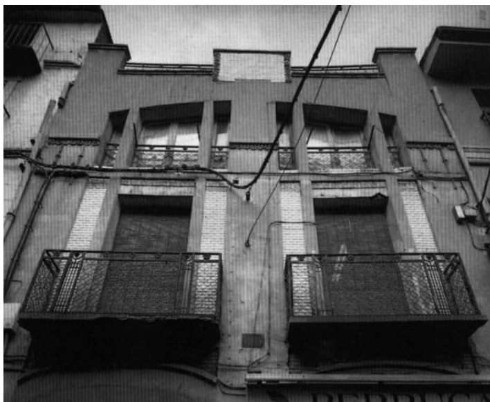
Uno de los primeros proyectos como arquitecto. La imprenta Perruca en la calle Abadía. Foto: Laborda Yneva.

Francisco Azorín Izquierdo, socialista, arquitecto, esperantista y masón [Monforte de Moyuela, 1885 - México DF, 1975]