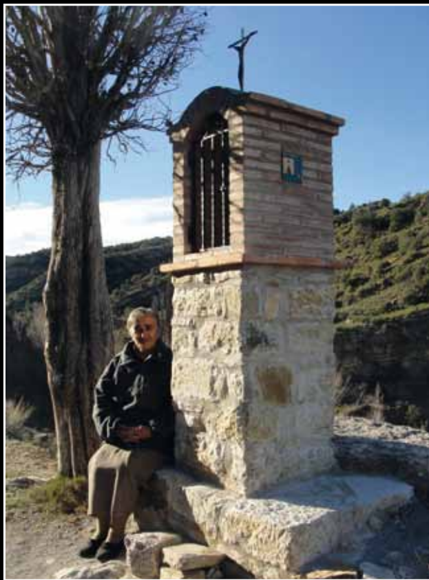
PEIRÓN DE LA VIRGEN DEL PILAR (LUÇO DE BORDÓN)