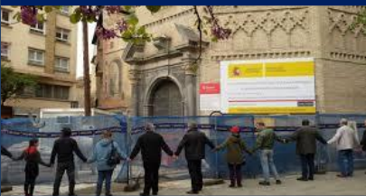
Imagen del Abrazo, una protesta pacífica y respetuosa que tanto parece molestar a las "gentes de bien". Como se puede ver, la Magdalena está en obras, lleva alrededor de 15 años cerrada y buena parte de los gastos de su restauración se paga con dinero público... Como en el resto de los templos católicos rehabilitados

Con este cartel tan chulo se convocaba a los vecinos desde las AAV de la Magdalena y Casco Viejo.